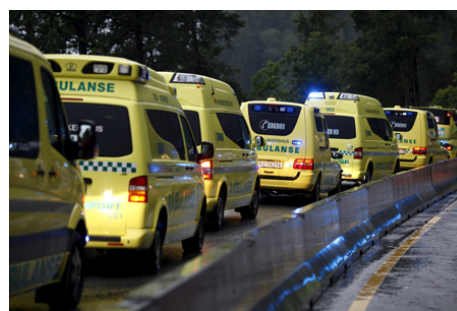
Ambulanser på vei til Utøya – 22. juli 2011

Røde Kors Hjelpekorps sin ambulansetjeneste er også en ressurs i den helhetlige katastrofeberedskapen som Røde Kors kan stille med. Våre ambulanser vil forventes å kunne stille ved ekstraordinære hendelser og katastrofer, for å bistå den profesjonelle ambulansetjenesten.