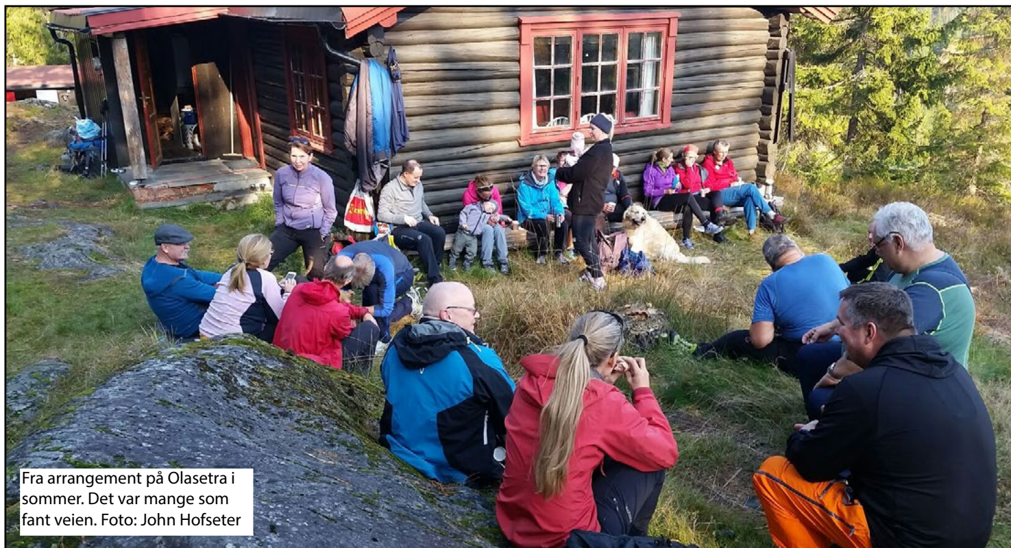
Fra arrangement på Olasetra i sommer. Det var mange som fant veien.

Skedsmo Røde Kors har 2070(2105) medlemmer ved årskifte.